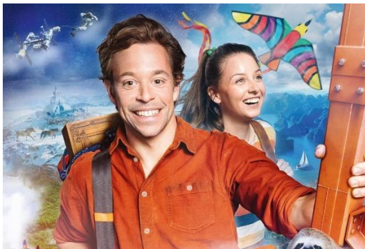
Checker Tobi und die Reise zu den fliegenden Flüssen